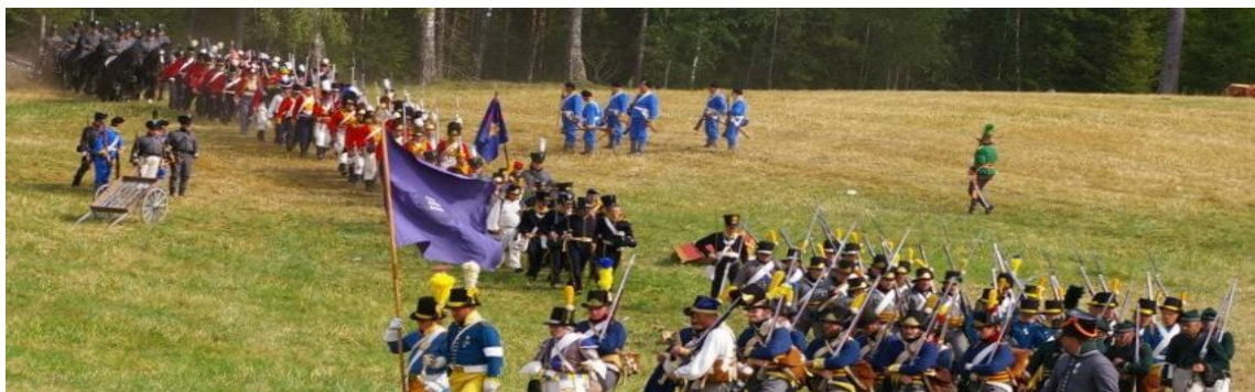
Angrepet på skansen og et feltslag.

Leir og slag for 1700 og 1800-talls Reenactment.